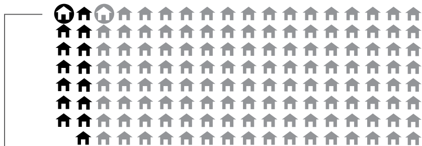
FIGURE 3. L'ITINÉRANCE AUTOCHTONE URBAINE AU CANADA

1 PERSONNE AUTOCHTONE SUR 5 dans les centres urbains est sans abri, comparé à 1 PERSONNE SUR 128 parmi la population générale.